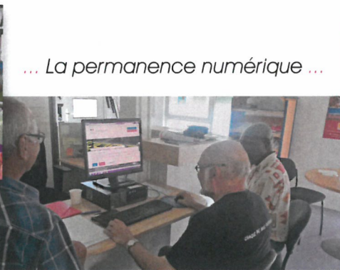
... La permanence numérique ...