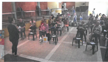
... La réunion d'information sur l'emploi direct ...