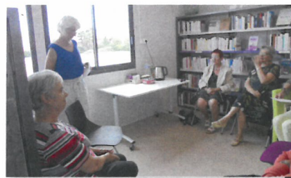
... La lecture à voix haute à Saleilles ...