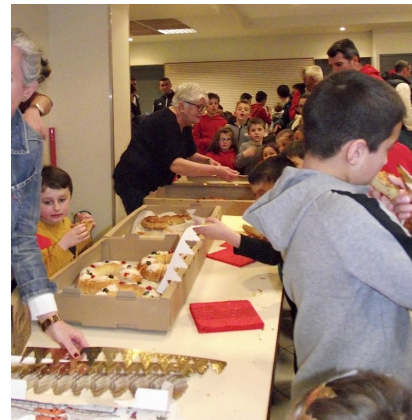
« Enfin la galette ! »