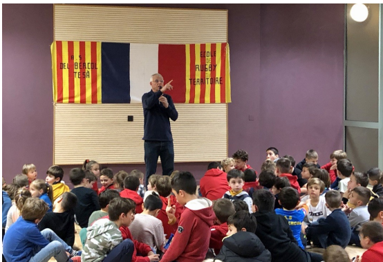
« Paris c'est là-bas ! »

L'association remercie tous les corneillanais(es) qui ont répondu généreusement à la présentation des vœux à tous nos citoyens au travers de la distribution du calendrier 2020.